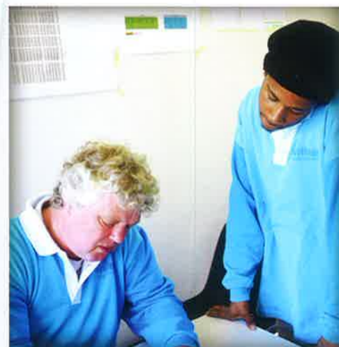
'HET WERK MOET ALTIJD DOORGAAN'