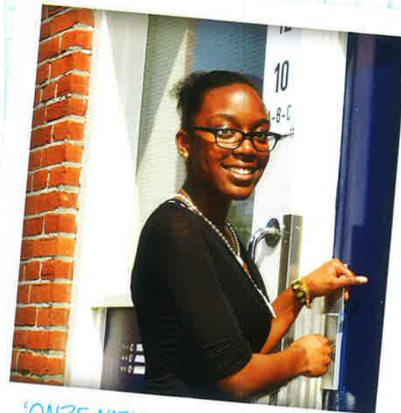
'ONZE NIEUWE GRIJZE KEUKEN STAAT HEEL MODERN!'

'Ik woon hier met mijn moeder en twee broers. In februari vorig jaar kregen we een brief van Woonstad Rotterdam dat onze woning gerenoveerd zou worden. Er kwam iemand langs om te kijken wat er moest gebeuren: een nieuw plafond, douche, toilet en keuken. In maart heb ik een maand lang bij mijn tante gelogeed. Ik kwam alleen af en toe terug om wat kleding op te halen. Ik schrok dan wel van de troep en het stof in huis. Pas toen het helemaal klaar was en weer ingericht zag ik hoe mooi het is geworden. Ik ben in dit huis geboren en opgegroeid en ik vind het leuk dat het er nu opeens heel anders uitziet. Het nieuwe gipsplaten plafond vind ik een grote verbetering en mijn moeder heeft een grijze keuken uitgekozen, dat staat heel modern. Ook merk je dat de ventilatie in huis beter is geworden door het mechanische systeem. Na het koken en douchen blijft het veel minder lang vochtig in huis.'