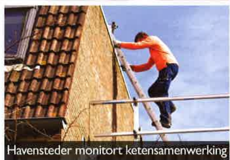
Havensteder monitort ketensamenwerking

Thema Techniek Bakstenen en metselmortels