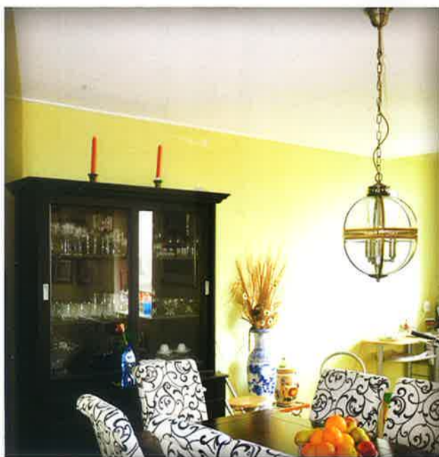
'DE GIPSPLATEN PLAFONDS ZIJN VEEL STRAKKER EN LICHTER DAN HET OUDE SYSTEEMPLAFOND'

Mijn vriendin is gelukkig met de nieuwe keuken. Zelf ben ik blij met de gipsplaten plafonds, veel strakker en lichter dan het oude systeemplafond. Als we dit allemaal zelf hadden moeten betalen, was dat flink in de cijfers gelopen. Ook het lekkageprobleem in de keuken, waar we al jarenlang last van hebben, is goed aangepakt. Het dak is compleet vernieuwd, dus dat zit voorlopig wel goed.'