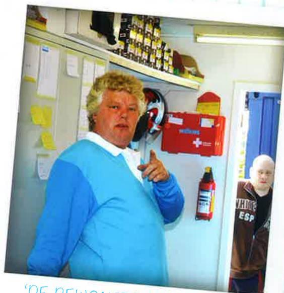
'DE BEWONERS HEBBEN BEHOEFTE AAN EEN VAST AANSPREEKPUNT'

'In deze buurt heb je kleine en grote woningen in een diverse staat van onderhoud. Dat maakt het plannen wat ingewikkelder. Bovendien stuiten we geregeld op onvoorziene reparaties, zoals een rotte vloer, lekkend dak of slechte muur, die de planning in de war schoppen. Soms vervelend, want de bewoners weten dan niet meer waar ze aan toe zijn. Daarom nemen we speciale uitlooptijden in de planning op, waarop we onvoorziene reparaties afhandelen. Het is fijn om met een vast team te werken, we zijn goed op elkaar ingespeeld en weten wat we aan elkaar hebben. Met Woonstad Rotterdam zit ik op één lijn. Het mooiste vind ik het als mensen na de renovatie tegen me zeggen dat ze nu fijner wonen. Dan heb ik mijn doel bereikt.'