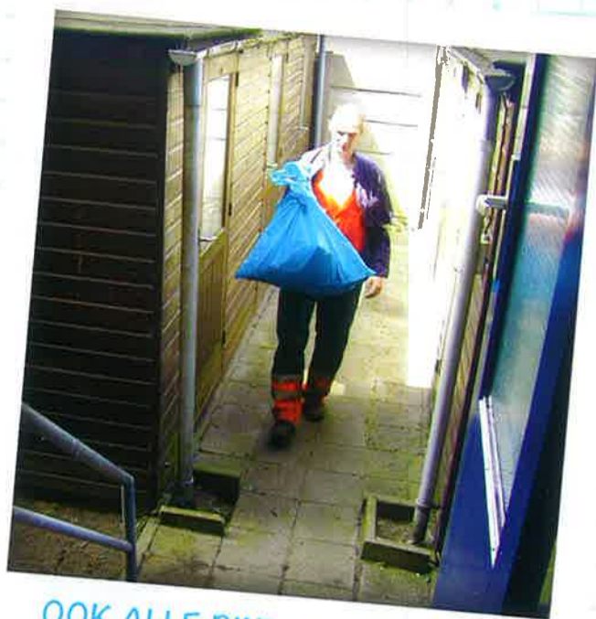
OOK ALLE BINNENTERREINEN EN PORTIEKEN ZIEN ER STRAKS WEER NETJES UIT