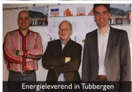
Energieleverend in Tubbergen