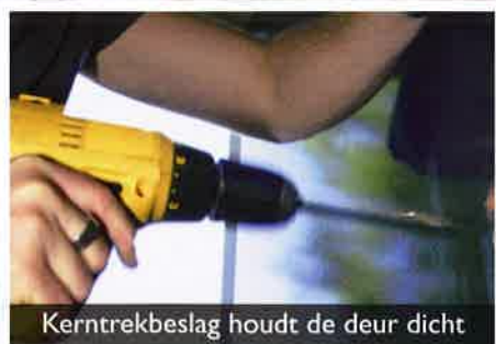
Kerntrekbeslag houdt de deur dicht